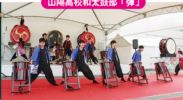
山陽高校和太鼓部「弾」