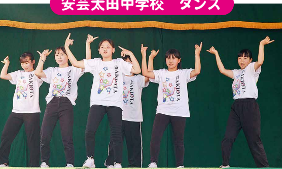
安芸太田中学校 ダンス